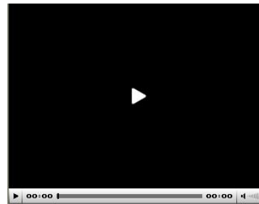
SWFファイル(プレーヤー部分)