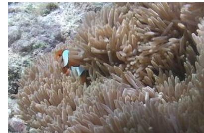
FLVファイル(動画部分)